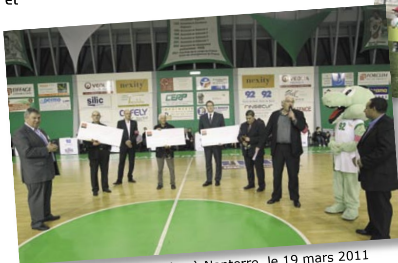
Remise des Trophées à Nanterre, le 19 mars 2011