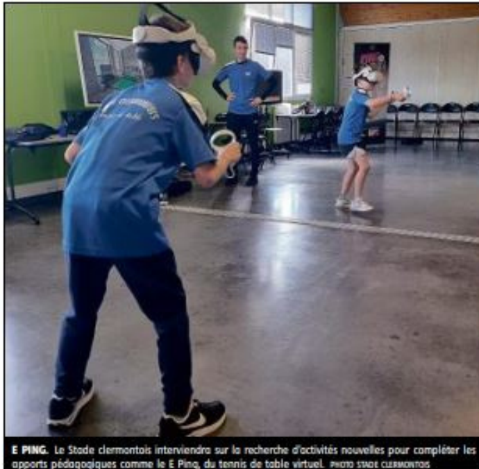
E PING. Le Stade clermontois interviendra sur la recherche d'activités nouvelles pour compléter les apports pédagogiques comme le E Ping, du tennis de table virtuel.