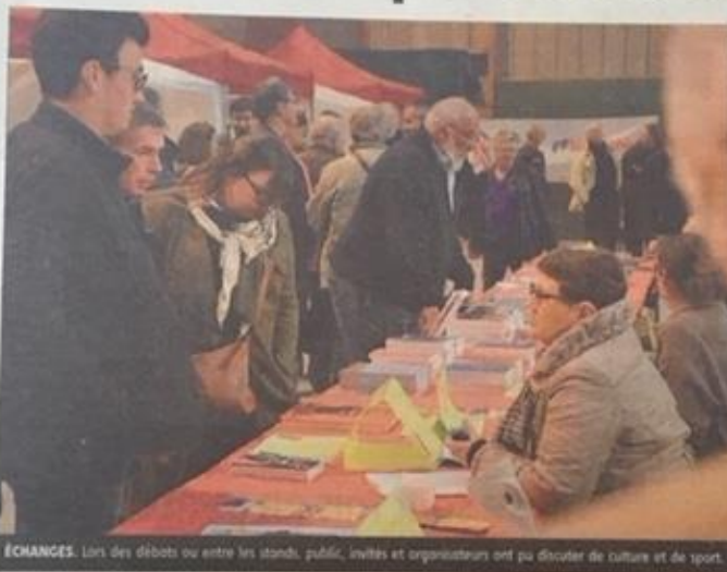
ÉCHANGES. Lors des débats ou entre les stands, public, invités et organisateurs ont pu discuter de culture et de sport.